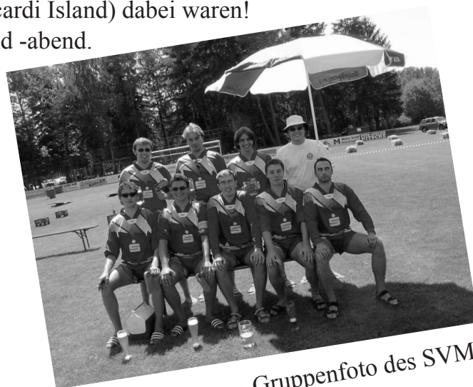
Gruppenfoto des SVM